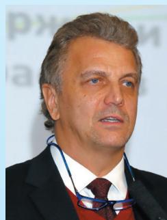
РАЗБРОДИН Андрей Валентинович

директор Департамента легкой промышленности и лесопромышленного комплекса МИНПРОМТОРГА России